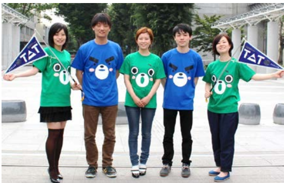
農工大公式キャラクター「ハッケン、コウケン」のキャラクターTシャツを着たスタッフが皆様をお待ちしています！

TUAT Formula 等の本学ならではのサークルが、実演・練習公開等を行う予定です。