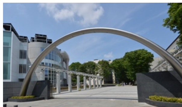
東京農工大学小金井キャンパス